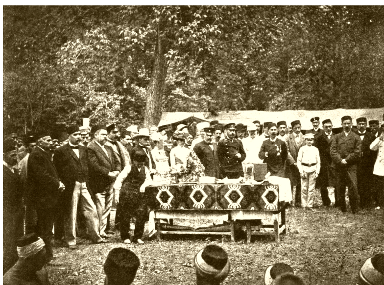
Часть группы гостей и читателей, бывших на молитве в день десятилетия газеты «Переводчик» в 1893 г. (слева) и ее двадцатилетия в 1903 г. (справа)