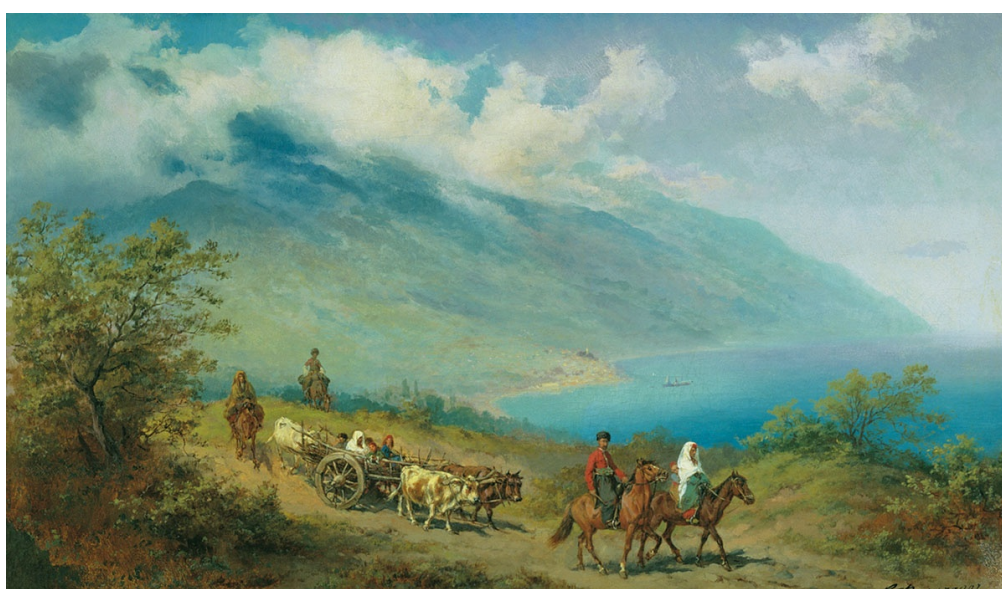
Филиппов К.Н. Крымские татары в пути. 1860-е гг.

Начиная с конца XVIII в., с приходом новой власти, на территории Крымского полуострова и за его пределами наблюдалось несколько волн массовых миграций местного мусульманского населения. В частности, это касалось большинства крымских татар, которые поэтапно на протяжении полутора столетий переселялись за пределы своей исторической родины. Своей масштабности и национального характера эмиграционные процессы крымских татар достигли в середине XIX в. и неоднократно продолжались вплоть до начала XX в. Несомненно, постоянные оттоки огромных масс коренного населения полуострова и близлежащих земель не могли не сказаться на дальнейшем развитии всего крымского региона. Массовые эмиграции повлекли за собой значительные изменения в экономической, демографической и культурной сферах жизни Крыма и его обитателей.