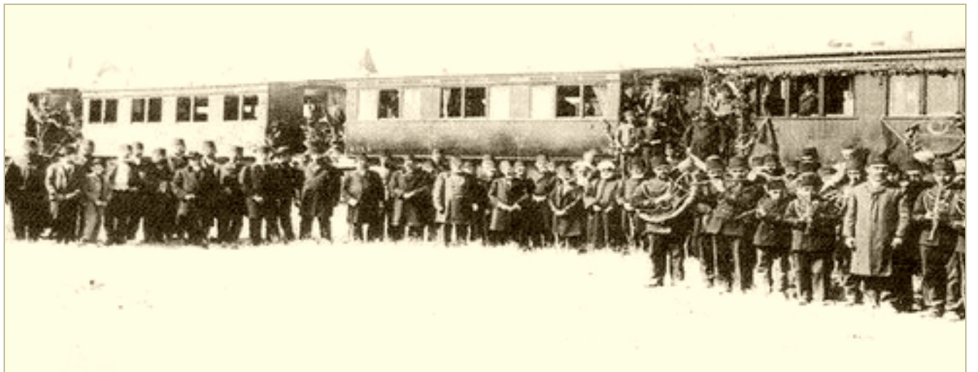
Открытие мухаджирского карачаево-балкарского селения Башхююк а присутствии губернатора Конийского вилайета Османской империи и оркестра. Фото начала XX в.