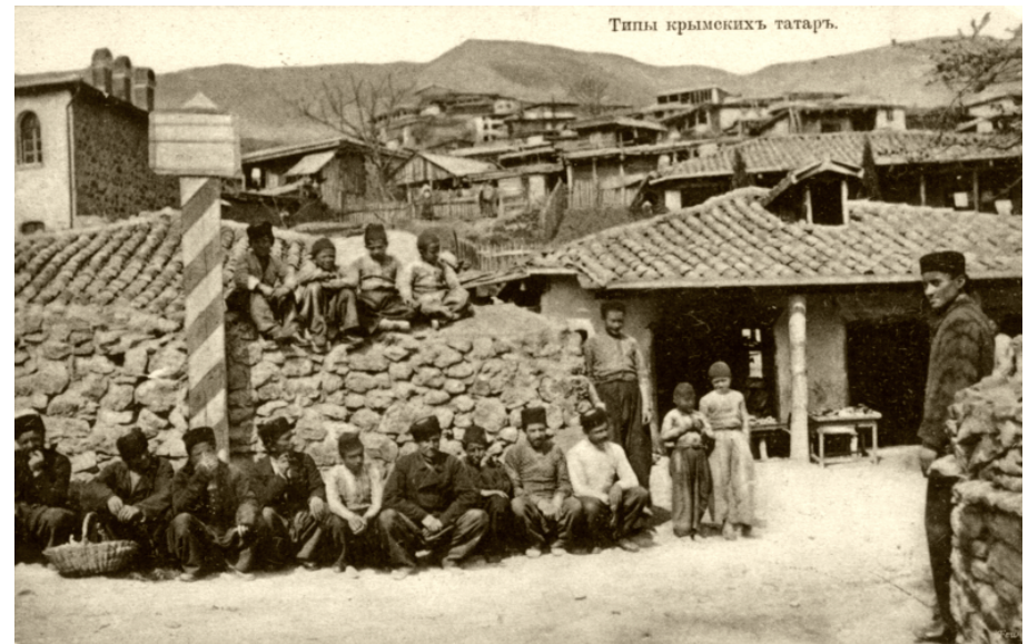
Крымские татары на почтовых открытках начала XX в.

Таким образом, И. Гаспринский, будучи свидетелем переселений 2-й половины XIX — начала XX вв., оставил после себя подробные свидетельства данных событий, а также видение проблемы одним из образованнейших представителей крымскотатарского общества. Публицистика И. Гаспринского не теряет своей актуальности и в наши дни, являясь богатейшим источником по изучению проблемы миграций крымских татар.