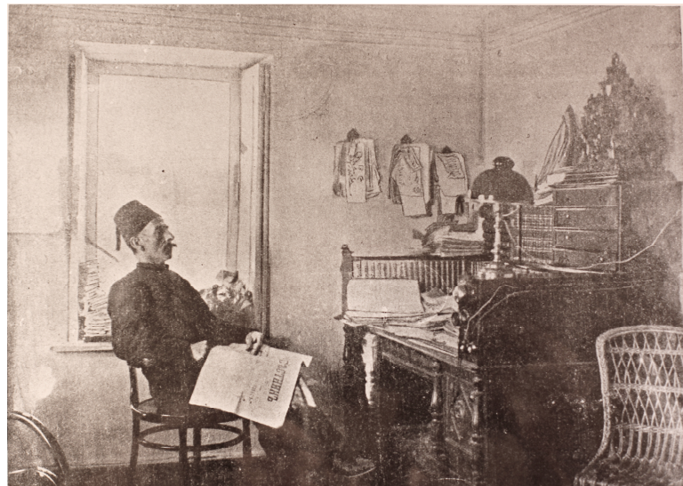
Слева — Исмаил Гаспринский в рабочем кабинете. Фото 1910 г. Справа — рабочий кабинет И. Гаспринского в Мемориальном доме-музее в Бахчисарае