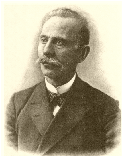
Исмаил Гаспринский (1851—1914)

В последние десятилетия проблема переселений крымских татар обрела особенную актуальность. Для полноты понимания современного положения вопроса следует прибегнуть к опыту предшествующих поколений. В связи с этим, следует отметить, что тема массовых миграций крымскотатарского населения неоднократно была отражена в периодических изданиях конца XIX — начала XX вв. Особое — и важнейшее — место среди них занимает первая крымскотатарская газета «Терджи-ман-Переводчик», издателем которой был Исмаил Гаспринский (1851—1914).