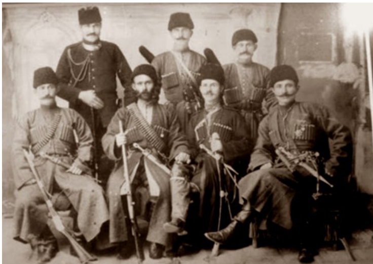
Черкесы-мухаджеры на турецкой военной службе. Фото конца XIX в.